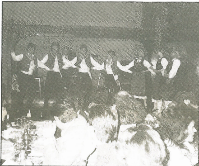
Το χορευτικό συγκρότημα «ΕΙΡΗΝΗ» Ηρακλείου Αττικής που συμμετείχε στο φετινό χορό του Συλλόγου μας στο κέντρο «ΝΕΦΕΛΗ» και χόρεψε χορούς της Μακεδονίας και της Θράκης ενθουσιάζοντας όλο τον κόσμο.