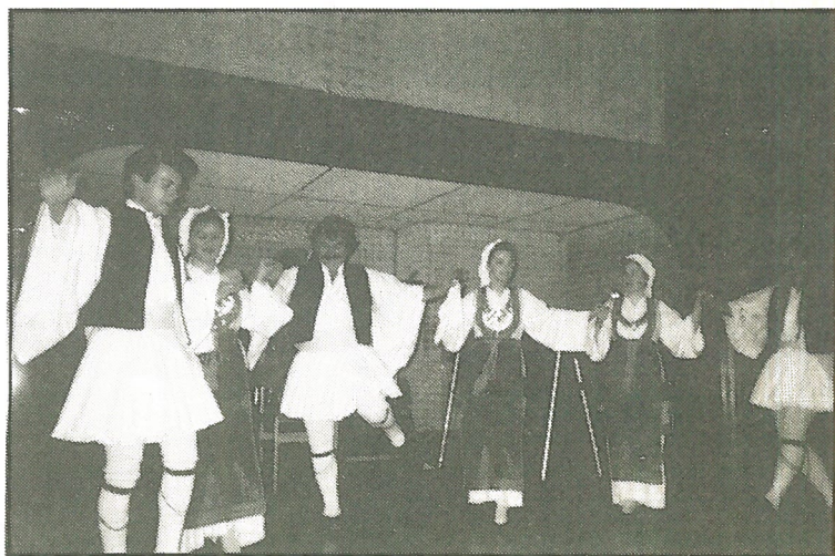
Οι φουστανελοφόροι και οι Σουλιώτισσες του χωριού μας.